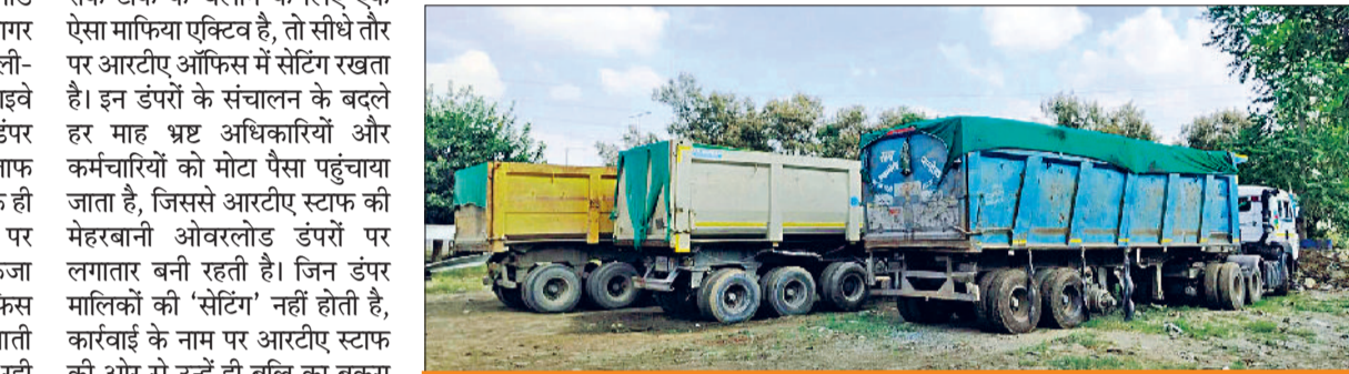
कसोला चौक के पास एक पार्किंग में इंपाउंड किए गए वाहन

अंडरलोड डंपर चलाने की सूट में मालिकों को बचत के नाम पर कुछ नहीं मिलता। ओवरलोडिंग ही उनके लिए मोटी कमाई का जरिया बना हुआ है। सूत्रों के अनुसार दोनों नेशनल हाइवे से ओवरलोड डंपरों को बिना किसी रोक-टोक के चलाने के लिए एक ऐसा माफिया एक्टिव है, तो सीधे तौर पर आरटीए ऑफिस में सेंटिंग रखता है। इन डंपरों के संचालन के बदले हर माह भ्रष्ट अधिकारियों और कर्मचारियों को मोटा पैसा पहुंचाया जाता है, जिससे आरटीए स्टाफ की मेहरबानी ओवरलोड डंपरों पर लगातार बनी रहती है। जिन डंपर मालिकों की ‘सेटिंग’ नहीं होती है, कार्रवाई के नाम पर आरटीए स्टाफ की ओर से उन्हें ही बलि का बकरा बनाया जाता है। सेंटिंग वाले ट्रांसपोर्टरों के वाहन आसानी से निकल जाते हैं। जैसलमेर नेशनल हाइवे पर भी यही हालत बन रहे हैं। इस रूट पर ऑफिस दूर होने के कारण चेंकिंग टीम भी जल्दी से नहीं पहुंच पातीं, जिस कारण ओवरलोड माफिया को परेशानी का सामना नहीं करना पड़ता।