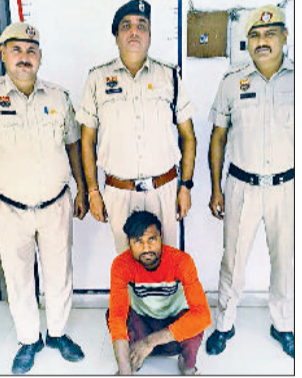
कंपनी में चोरी का आरोपी पुलिस टीम के साथ।