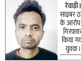
रेवाड़ी। साइबर ठगी के आरोपी में गिरफ्तार किया गया युवक।

पुलिस इस मामले में तीन आरोपियों को पहले ही गिरफ्तार कर चुकी है