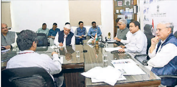
रेवाड़ी। नितिन गडकरी के साथ बैठक में मौजूद राव इंद्रजीत सिंह व भूपेंद्र यादव।

परस्पर राजनीतिक विरोधी माने जाने वाले केंद्रीय मंत्री भूपेंद्र यादव व राव इंद्रजीत सिंह राजस्थान से दूषित पानी नेशनल हाइवे पर आने सहित दूसरे मुद्दों को लेकर बुधवार को केंद्रीय परिवहन मंत्री नितिन गडकरी से मिले। दोनों मंत्रियों ने जहां दूषित पानी के मुद्दे से गडकरी को अवगत कराया, वहीं गुरुग्राम व रेवाड़ी के बीच निर्माणाधीन नेशनल हाइवे में देरी को लेकर राव ने परिवहन मंत्री के समक्ष आपत्ति दर्ज कराई। बैठक में गडकरी ने बनीपुर चौक फ्लाईओवर का निर्माण आगामी जनवरी माह तक पूरा कराने के बाद रिपोर्ट पेश करने के आदेश संबंधित अधिकारियों को जारी कर दिए। राजस्थान की ओर से आने वाले दूषित पानी की समस्या लंबे समय से धारूहेड़ा और भिवाड़ी के लोगों के लिए आफत बनी हुई है। धारूहेड़ा में रेवाड़ी-सोहना नेशनल हाइवे पर नगर पालिका की ओर से तत्कालीन सीएम मनोहरलाल के निर्देश पर रैंप बनाया गया था,