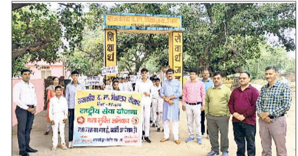
नारनौल। तंबाकू नशा मुक्ति रैली निकालते विद्यार्थी व स्टाफ सदस्य।

सरकारी अस्पतालों में आरक्षित कर दिया। जिसके कारण गरीब व्यक्ति जो आयुष्मान व चिरायु योजना के तहत गंभीर बीमारियों का इलाज निजी इमैलन अस्पतालों से करवाते थे, अब निजी अस्पतालों से नहीं करवा सकेंगे। उन्हें सरकारी अस्पतालों के चक्कर काटने पड़ेंगे। जहां इन बीमारियों के इलाज की सुविधा तथा व्यवस्था नहीं है। किसान, मजदूर, अनुसूचित तथा गरीब लोग इन सरकारी अस्पतालों में बिना संसाधन, बिना मशीन, बिना विशेषज्ञ व बिना सुविधाओं के गंभीर बीमारियों का इलाज कैसे करा पाएंगे। उन्होंने कहा कि सरकार के इस निर्णय से अब गरीब लोग प्राइवेट अस्पतालों में कूल्हा बदलना, घुटना बदलना, हर्निया, कान के पर्दे की समस्या, अपेंडिक्स, टॉसिल, गले, बवासीर, यूरिनल, उदर हिस्टेरेक्टॉमी, सीओपीडी आदि गंभीर बीमारियों का इलाज नहीं करवा पाएंगे। उन्होंने कहा कि सरकार ने केवल अपना बजट देखा है, जबकि गरीब लोगों की स्थिति नहीं देखी।