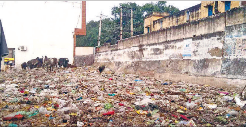
महेंद्रगढ़। मंडी में लगे कूड़े का ढेर।

बेसहारा गोवंश के दिनभर कूड़े के ढेरों में मारते रहते हैं मुंह