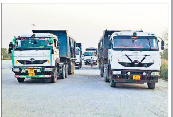
रेवाड़ी। जैसलमेर हाइवे से गुजरते हुए खनिज सामग्री के वाहन।

सीएम फ्लाईंग का एक्शन इसका प्रमाण ओवरलोड वाहनों पर एक्शन लेने में आरटीए कार्यालय की नाकामी का प्रमाण सीएम फ्लाईंग खुद है। जब भी नेशनल हाइवे पर सीएम फ्लाईंग चेंकिंग के लिए पहुंचती है, तो एक ही रात में बड़ी संख्या में ओवरलोड वाहन पकड़े जाते हैं। गत दिनों तीन बार सीएम फ्लाईंग की टीम चेंकिंग के लिए हाइवे पर उतरी तो 50 से अधिक ओवरलोड वाहन शिकंजे में फंस गए थे। इन वाहनों पर लाखों रुपये जुमाना किया गया था। सीएम फ्लाईंग की सुस्ती के साथ ही ओवरलोड पर एक्शन भी लगभग बंद हो जाता है।