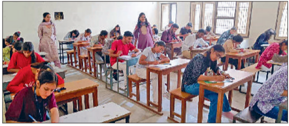
नारनौल। निबंध प्रतियोगिता में भाग लेते विद्यार्थी।