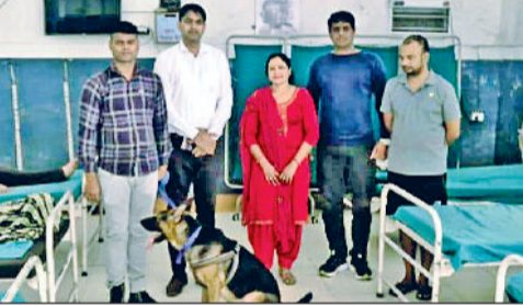
रेवाड़ी। नशामुक्ति केंद्र में स्नीफर डॉग के साथ तलाशी लेते हुए ब्यूरा की टीम।