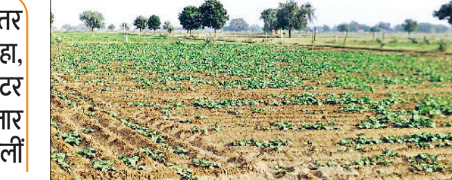
रेवाड़ी। जमीन से बाहर आ रही एक खेत में खड़ी सरसों की फसल।

हवा में नमी का स्तर 87 प्रतिशत तक रहा, जबकि 10 किलोमीटर प्रति घंटा की रफ्तार से हवाएं चलीं