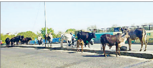
रेवाड़ी। नारदवाली चौक पुल पर खड़ी बेसहारा गाएं।

कार्तिक मास के शुक्ल पक्ष की अष्टमी तिथि 30 अक्टूबर को गोपाष्टमी का पर्व मनाया जाएगा। इस दिन गायों की पूजा की जाती है। धार्मिक मान्यता है कि कार्तिक शुक्ल प्रतिपदा से लेकर सप्तमी तक भगवान श्रीकृष्ण ने अपनी उंगली पर गोवर्धन पर्वत धारण किया था। 8वें दिन इंद्रदेव अपना क्रोध त्यागकर श्रीकृष्ण के पास क्षमा मांगने आए थे, तभी से कार्तिक शुक्ल अष्टमी के दिन गोपाष्टमी का पर्व मनाया जाता है। श्रीमद्भागवत गीता में भी उल्लेख है कि जब देवता और असुरों ने समुद्र मंथन किया था, तो उसमें कामधेनु गाय निकली थी