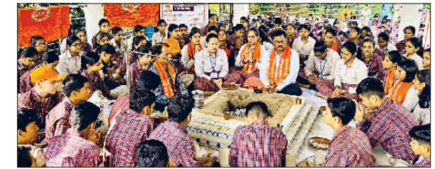
नारनौल। हवन करते विद्यार्थी व स्कूल स्टाफ।

डीएवी स्कूल में दो अक्टूबर से 29 अक्टूबर तक वैदिक संस्कार पुण्य मास मनाया गया। इसके अंतर्गत विद्यालय में विभिन्न गतिविधियों का आयोजन करवाया गया। जिनमें रंगोली, मेहंदी, थाली सजाओ, दीया सजाओ, स्वच्छता अभियान शिविर आदि को शामिल किया गया। इसी कड़ी में 20 अक्टूबर को महर्षि दयानंद के बलिदान दिवस को प्रेरणा पर्व के रूप में मनाया गया। 29 अक्टूबर को योगी सूरि महासचिव