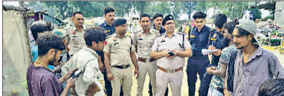
रेवाड़ी। विदेशी नागरिकों की पहचान के लिए छानबीन करते पुलिस।